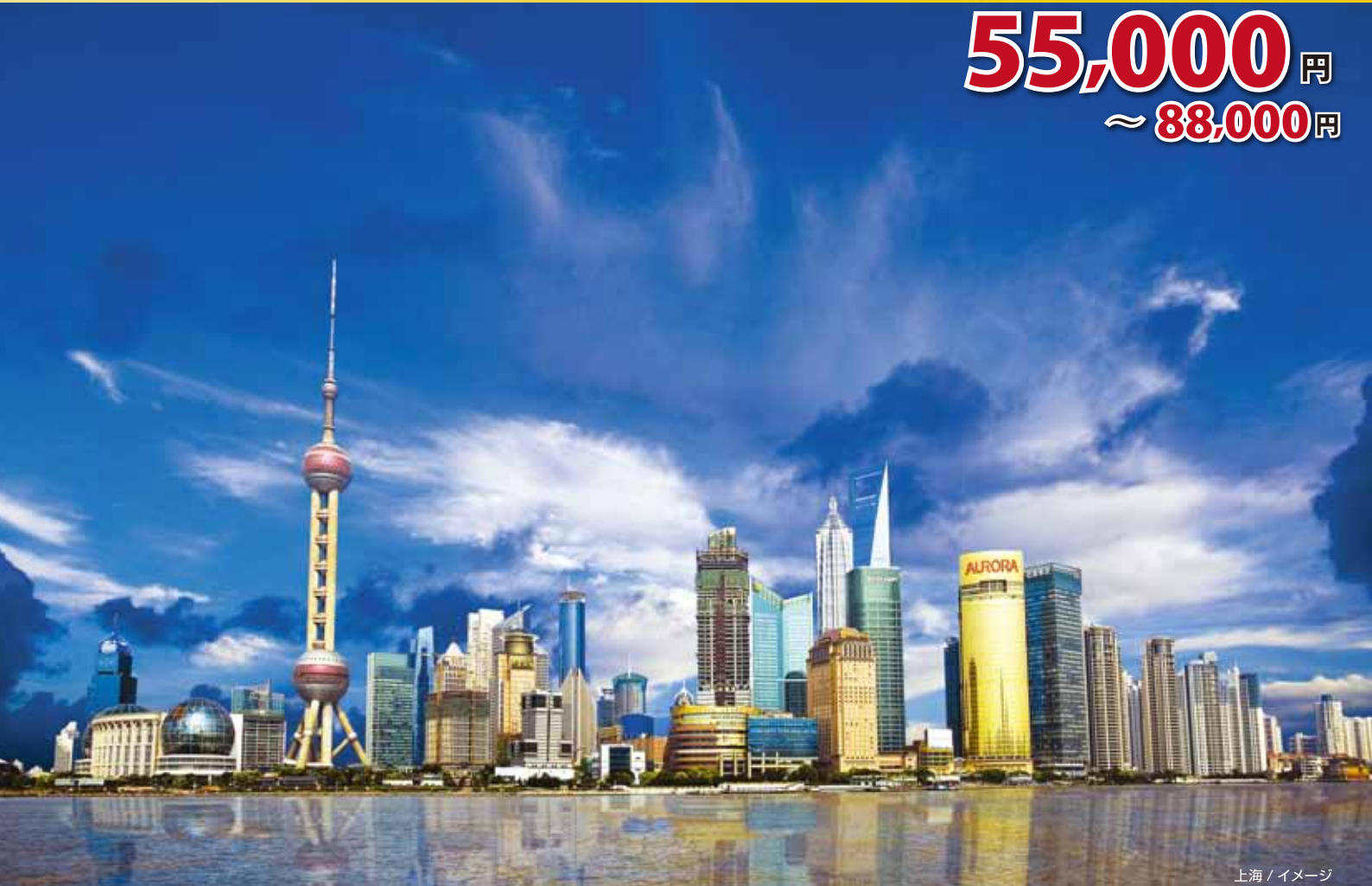
上海 / イメージ